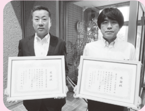
左より、株式会社 架設工事佐々木組 様（市内下黒瀬） 株式会社 丸山電業社 様（市内中央町） 当日ご欠席の有限会社 ハタノ商会様（市内寺社）、 湯本館様（市内今板）、株式会社 福田組阿賀東蒲営業所様 （東蒲原郡阿賀町）へは、後日感謝状をお届けいたしました。

募金に協力下さる方と、その募金により助成を受ける方が互いに共同募金について理解を深めるよい機会となりました。