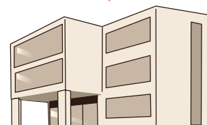
新潟県共同募金会